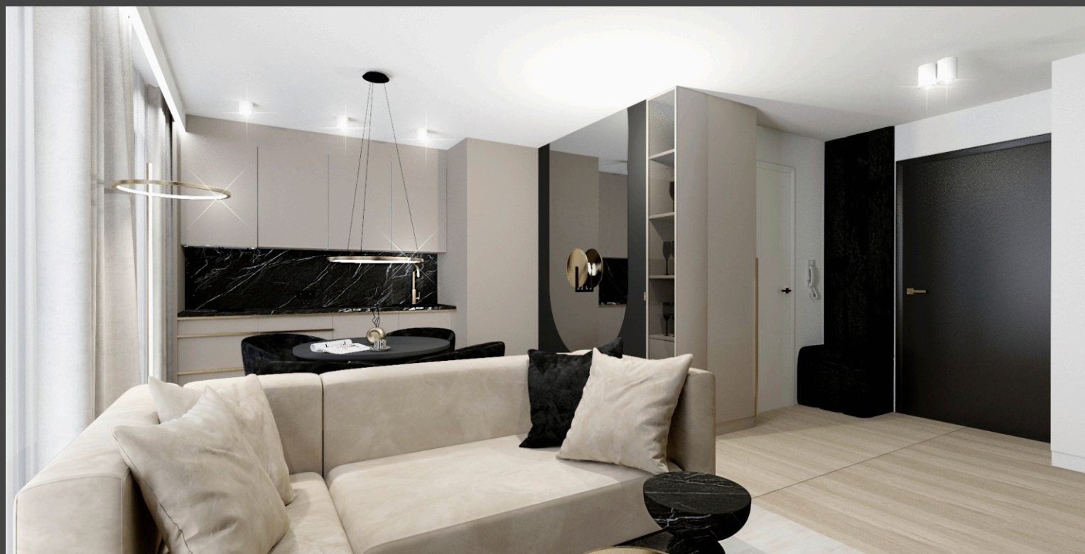
PRZYKŁADOWA ARANŻACJA CZĘŚCI DZIENNEJ Z ANEKSEM KUCHENNYM