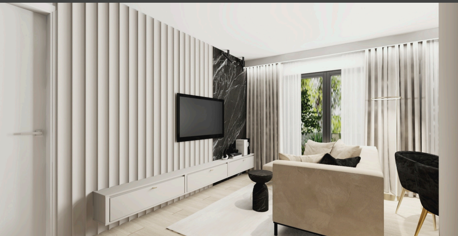
PRZYKŁADOWA ARANŻACJA CZĘŚCI DZIENNEJ Z ANEKSEM KUCHENNYM