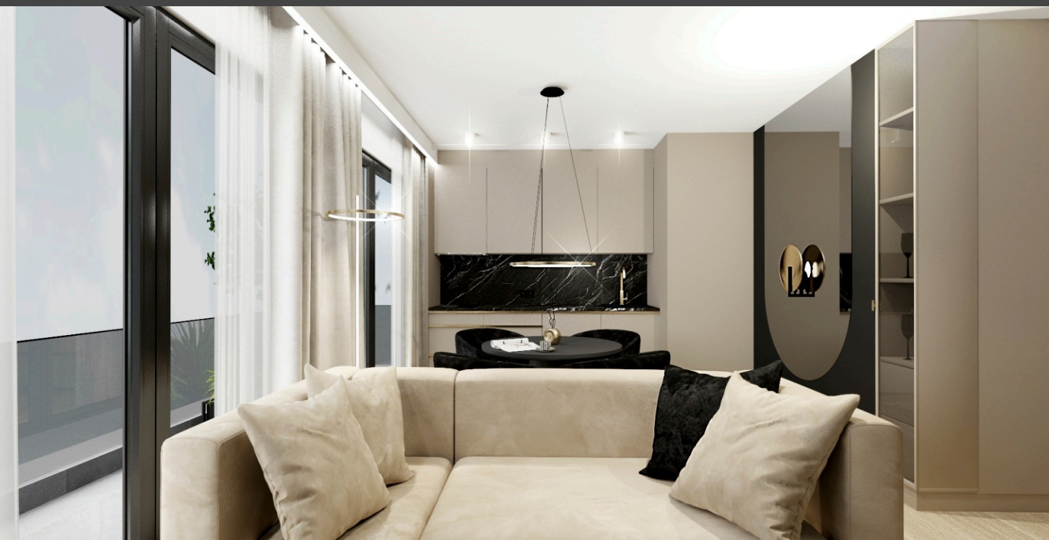
PRZYKŁADOWA ARANŻACJA CZĘŚCI DZIENNEJ Z ANEKSEM KUCHENNYM